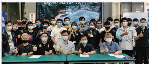
全國創新維修技術競賽合照