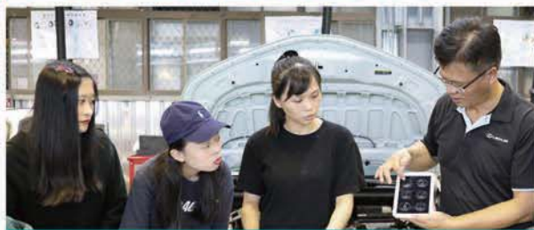
汽車智慧診斷系統實習