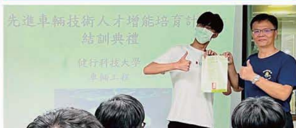
汽車修護增能培育輔導活動