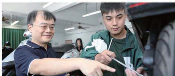
機車修護乙級檢定實習