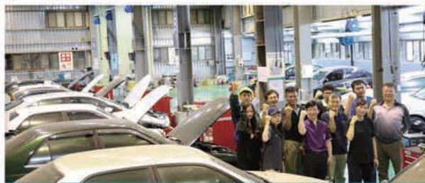
汽車修護乙級檢定場地與師資群