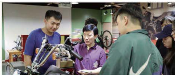
電動二輪車與哈雷重型機車實習