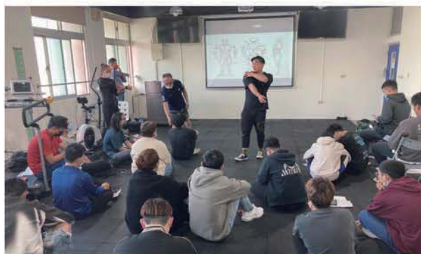
健康運動行銷教室

身心障礙 申請入學 繁星計畫 運動績優 技優甄審 甄選入學 聯登分發 單獨招生 產學攜手 新住民(獨招) 進修部獨招