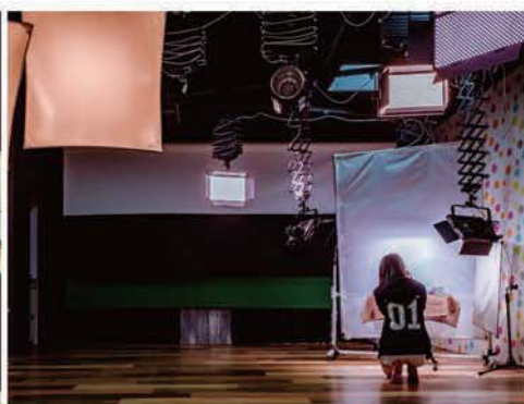
行銷企劃實驗室 (攝影棚)