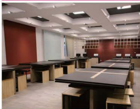
創意與創新實驗室