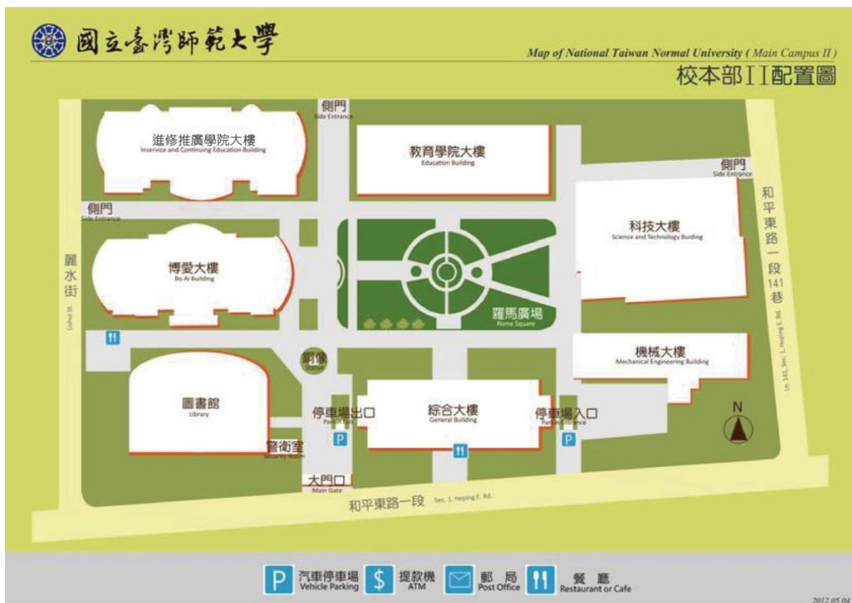
國立臺灣師範大學圖書館校區配置圖