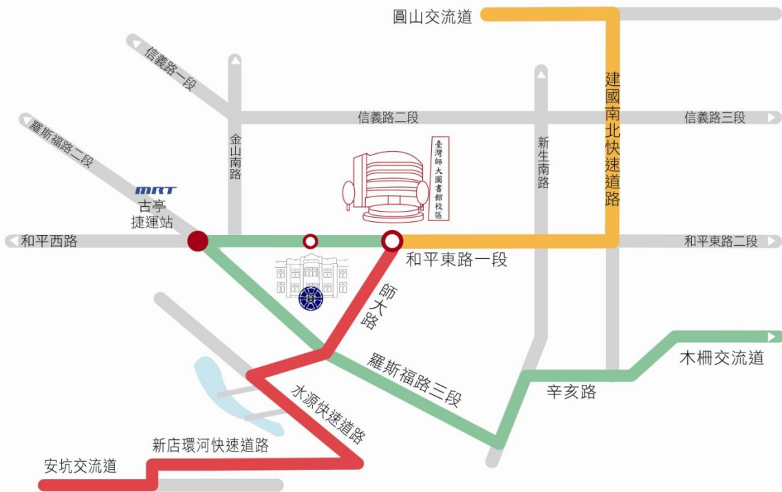
國立臺灣師範大學校園高速公路指標